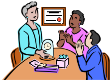
Cambios a su plan de retiro

Parte de nuestro nuevo plan es para mantener el nivel de acumulación de beneficio aproximadamente constante con el que está siendo acumulado actualmente para participantes de la marqueta ($70.80). En el 2011, el nivel de contribución del empleador será aumentado 30¢ por hora, el nivel de porcentaje será disminuido, y los participantes acumularán aproximadamente el mismo beneficio que están acumulando actualmente ($70.80).