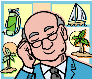
Cambios Futuro a los beneficios